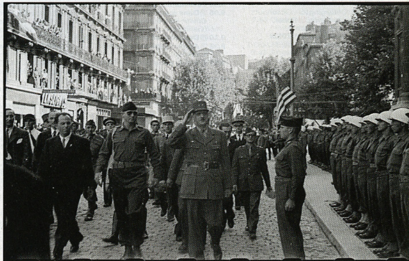
AUBRAC LE RÉSISTANT (À GAUCHE, EN COSTUME), EN SEPTEMBRE 1944.